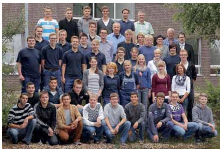
Die neuen Auszubildenden bei ihrer offiziellen Begrüßung in Lemförde.