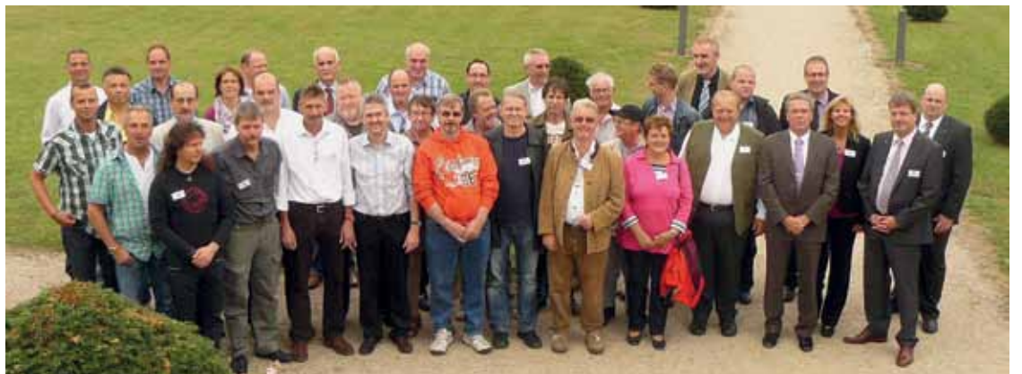
Die Jubilare des Standortes Simmern mit Werk- und Personalleitung sowie Vertretern des Betriebsrates.