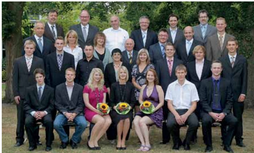
Ehemalige Auszubildenden und Gäste