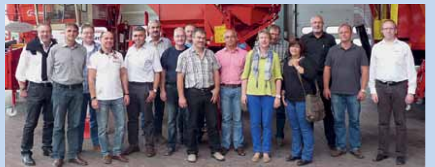
Die Ideenmanagement-Koordinatoren des Geschäftsfeldes Gummi & Kunststoff beim Werksbesuch der Nachbarfirma Grimme in Damme.