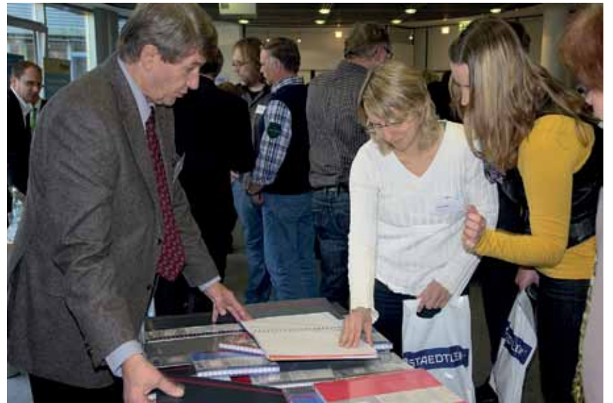
Die Besucher der Hausmesse erfuhren viel über neue Büromaterialien.